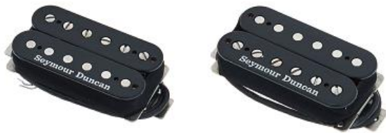
SH-JB Hot Rodded Humbucker